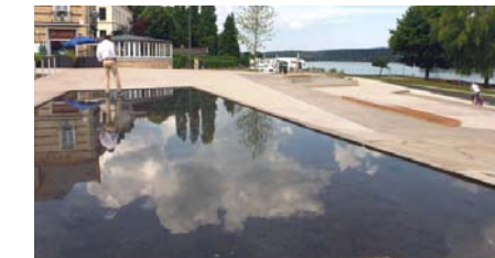
Bassin miroir sans fontainerie