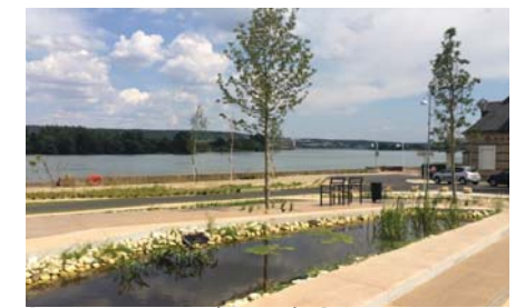
Bassins en cascade vers la Seine