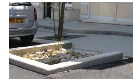
Bassin planté de collecte des eaux de voiries