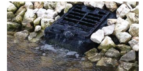
Fonctionnement entièrement gravitaire