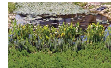
Bassin de phytoremédiation