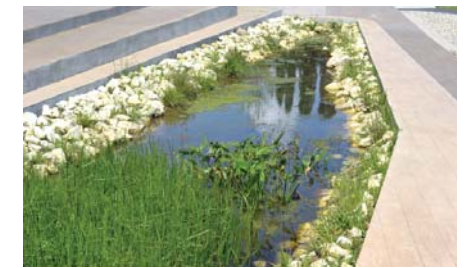
Bassin de phytoremédiation